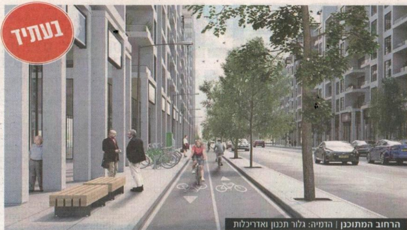
הרחוב המתוכנן | הדמיה: גלור תכנון ואדריכלות